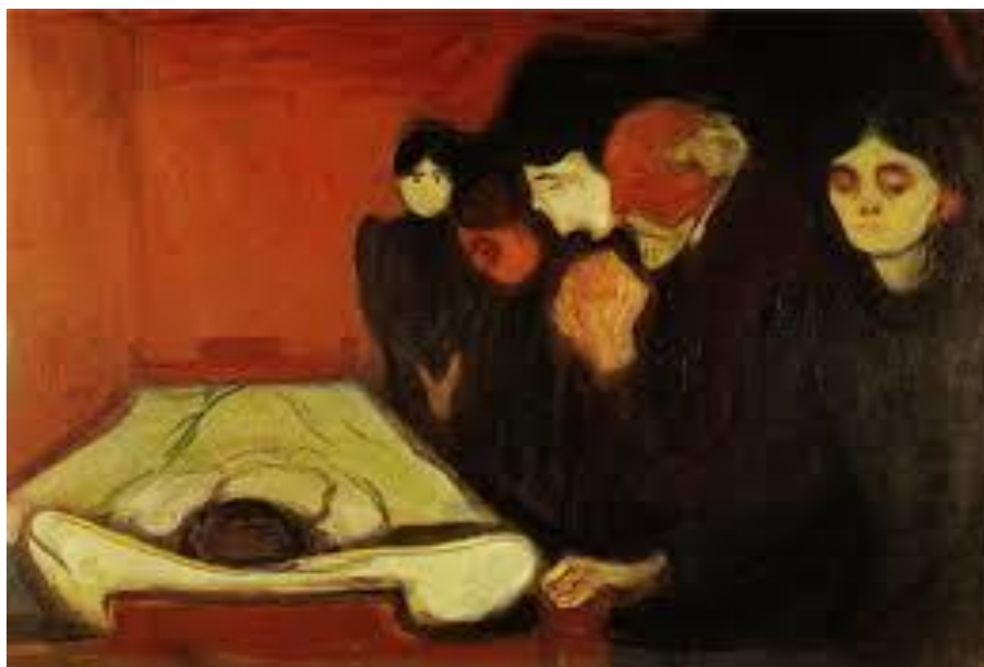
By the death bed, 1896 by Edvard Munch

Ο Ιβάν Ίλιτς πίστευε πως είχε βρει την ευτυχία και πως ήταν ολοκληρωμένος σαν άνθρωπος, αλλά τη στιγμή που πλησιάζει στο θάνατο συνειδητοποιεί πως ζούσε σε έναν ψεύτικο κόσμο,σε μία ψευδαίσθηση. Η ευτυχία για τον καθένα είναι κάτι υποκειμενικό. Πολλές φορές οι άνθρωποι πιστεύουν πως είναι ευτυχισμένοι, αλλά είναι πιθανό να έχουν παραπλανηθεί και να μην αντιλαμβάνονται πού βρίσκεται η πραγματική ευτυχία.